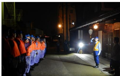
所長の挨拶(金華水防団)