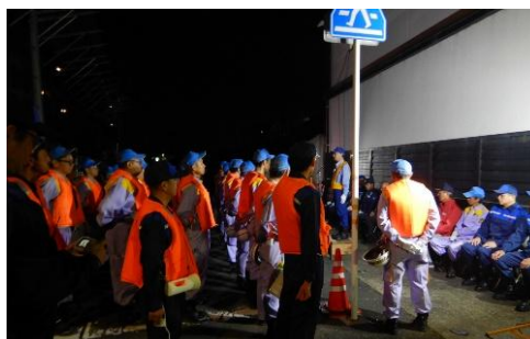
所長の挨拶(長良西水防団)